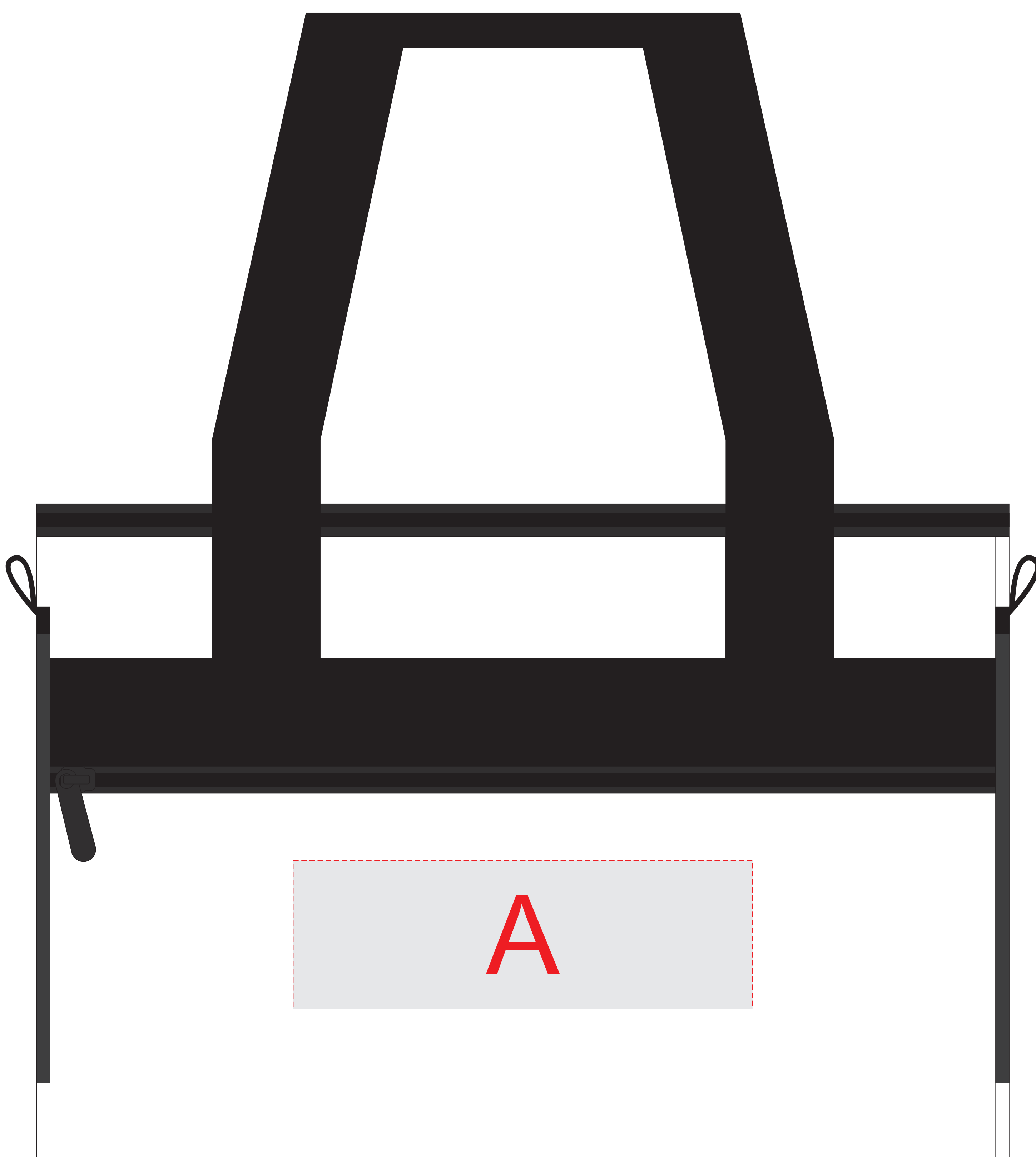
вид спереди (карман)