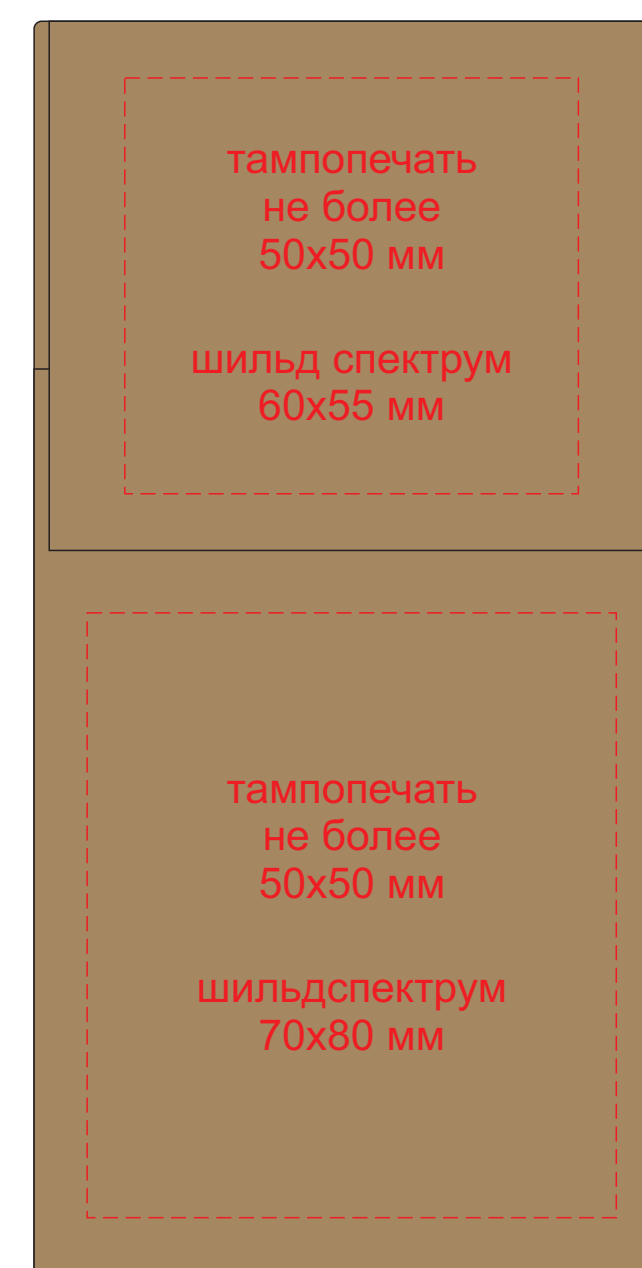
лицевая сторона в сложенном состоянии