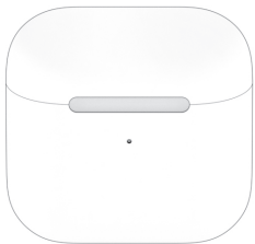
Кейс для зарядки и хранения