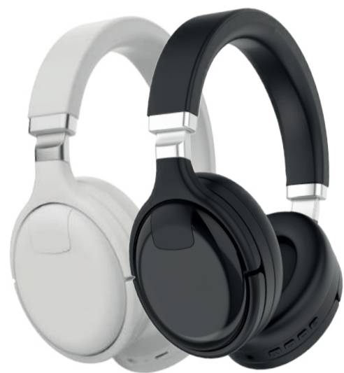
Модель: НТW-НХ2 и НТW-НХ3