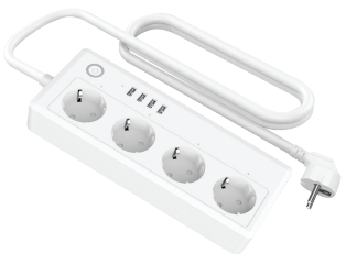
Модель: IoT PS45

Больше продуктов и подробная информация об использовании HIPER IoT на нашем сайте https://hiper-power.com/catalog/iot/