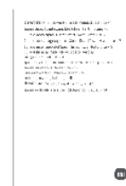
Краткое руководство по началу работы