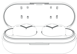
Кейс для зарядки и хранения