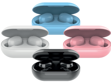
Модель: HTW-LX1, HTW-LX2, HTW-LX3, HTW-LX4